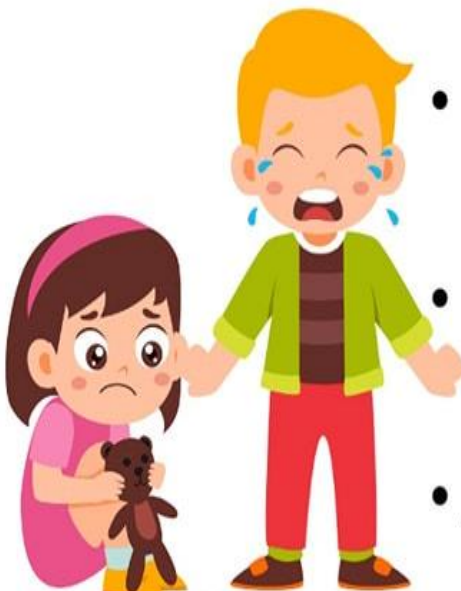
Kamila Olga Psychologia